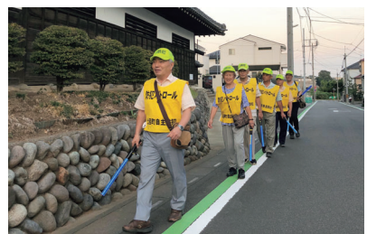
▲地域の安全のために! 交通安全・防犯活動