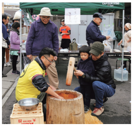
▲楽しさいっぱい! お祭りやレクリエーション活動