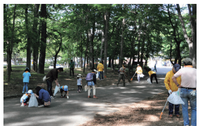
▲まちがきれいだと気持ちいい! 環境美化活動