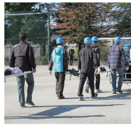
▲日頃の備えが大切! 防災活動