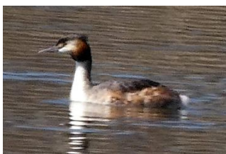
カンムリカイツブリ

なお、深作川の八反田橋下流右岸(西岸)で通行止めが解除されていない場合、探鳥会コースや遊水地の見学方向等を変更します。