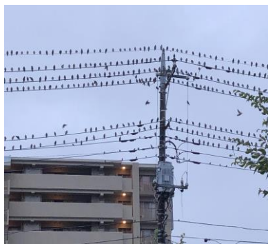
（電線に止まるムクドリの群れ）