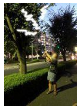
（嫌がる音を鳴らす）