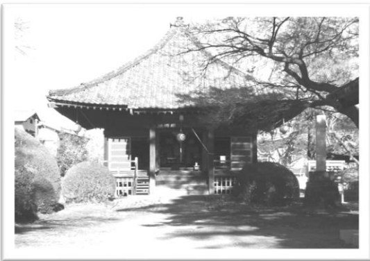
島町の薬王寺（島町1086）

宝積寺の役行者像は公開されていませんが、実際に円空仏を見てみたい、という方は、島町の薬王寺で年6回の祭礼と元旦に、