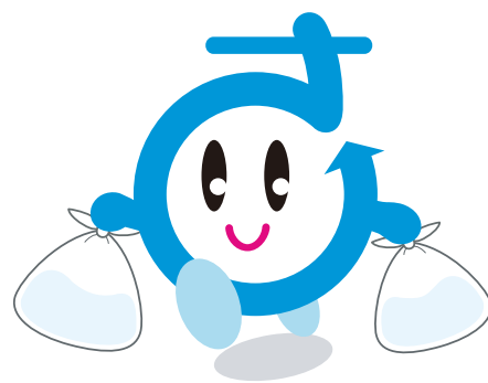
さいたま市環境キャラクター「さいちゃん」